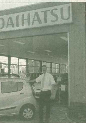
chen. De verkoop van de Daihatsu

bijzonder trots te zijn op het tot nu toe behaalde resultaat. 'Vooral de modellen Cuore en Sirion komen we steeds vaker tegen in Lelystad en omgeving.' Metz heeft extra auto's ingekocht, waardoor veel modellen uit voorraad en dus snel afgeleverd kunnen worden.